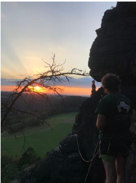
Klettern in der Abendsonne