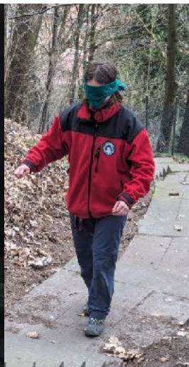
Ich tappe ganz schön im Dunkeln