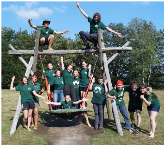
Das Umweltbildungsteam im Herbst 2024

Mit dem letzten Monat meines FÖJ kam noch mal viel frischer Wind ins Team, da sowohl einige neue, als auch viele ehemalige Mitarbeiter für die Schulungswochen und die darauffolgende Zeit zusammenkam. In der WG wurde es für uns damit auch richtig turbulent, aber da von Anfang an ein richtig gutes Miteinander herrschte, konnten wir diese Zeit noch mal so richtig genießen.