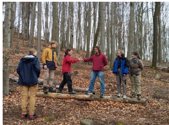
Programmvorstellung in der Waldhusche

Nach Ostern begann dann die Saison, die mit einer zweiwöchigen Schulung zur Vorbereitung auf die Umweltbildungsprogramme begann. Neben der Vorstellung der Routen, Inhalte und Aktivitäten, beinhaltete sie das Kennenlernen des Teams und einige Einheiten zur Geschichte des Nationalparks und der Idee dahinter.