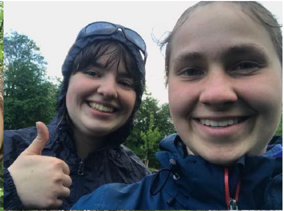
Im Regen standen wir häufiger mal