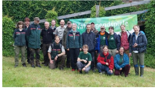
Gemeinsam mit der Nationalparkwacht gestalteten wir die Stationen bei den Waldjugendspielen