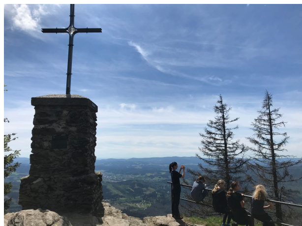
Auf dem Falkenstein (im Bayerischen Wald)