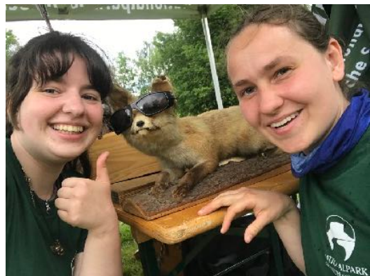
Ein Daumen hoch für dieses tolle Jahr

Ich bin sehr dankbar, dass ich diese Erfahrung machen durfte!