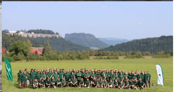
Die gesamte Nationalpark- und Forstverwaltung beim Fachschaftstag