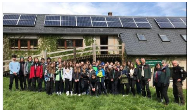
Alle Teilnehmer des Austausches an der Sellnitz