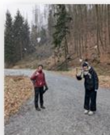
Wege für das Programm Ausbalancieren in Schmilka ablaufen