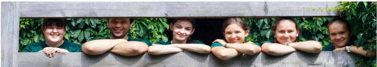
Gruppenfoto aus dem Herbst

Selbstverständlich gab es ebenso Schulklassen, welche nicht diese Motivation ausstrahlten und das Bildungsprogramm beispielsweise durch gegenseitige Sticheleien, fehlende Konzentration bei Erklärungen oder durch das Ignorieren von Regeln nicht immer einfach gestalteten. Folglich gab es auch Tage, an denen man die Gruppe gern wieder dem Lehrer nach Programmschluss übergab. Aber gerade aus solchen Programmen können viele neue Erfahrungen gezogen werden. Zumindest wird bei diesen Gruppen auf jeden Fall Geduld, Durchsetzungskraft und vor allem Kommunikation geschult.