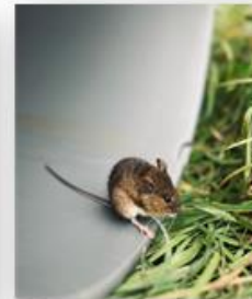
Waldmaus aus der Sellnitz befreien