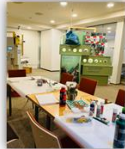
Bastelstand beim Apfelfest im Herbst