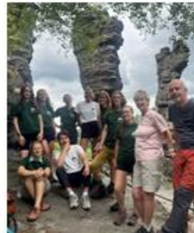
Abschlusswanderung im Frühling