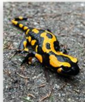
Feuersalamander-Sichtung am Zeughaus— eigentlich wollten wir Infostellen wiedereröffnen