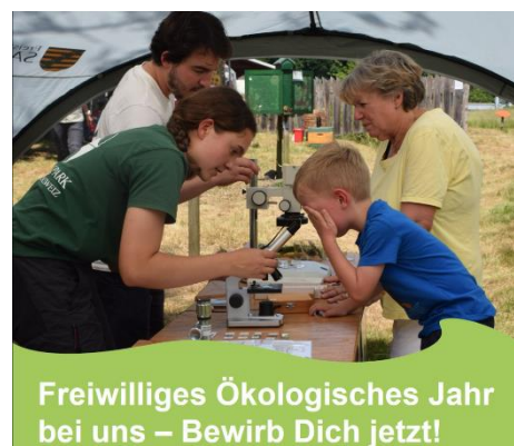
Werbung für ein FÖJ im NLP: hier Mikroskopieren während des Sellnitzfestes

Weiterhin durfte ich während des Jahres viele tolle Menschen kennenlernen, mit denen ich mich, anders als in der Schule zuvor (Ausnahmen gibt es natürlich auf beiden Seiten), sehr gut verstanden habe. Telefonieren hat sich am Ende als nicht so schlimm oder unangenehm herausgestellt. Oft genug hieß es Nationalpark- und Forstverwaltung,