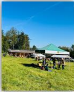
Waldfest und Eröffnung Walderlebniszentrum Leupoldshain