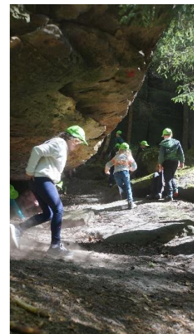
Höhlenerkundung im Bärengrund

Um ein aktionsreiches Wochenende zu erleben, wurde sich am Samstag, dem 26.4., am Walderlebniszentrum in Leupoldishain getroffen, wo sich auch die Übernachtung mit Isomatte und Schlafsack stattfinden sollte. Nach dem Aufbau der Schlafplätze und einer kleinen Stärkung aus der mitgebrachten Brotdose ging es an verschiedenste Kennenlernspiele, gefolgt von einer Wanderung zum nahegelegenen Bernhardstein mit spielerischer Begleitung. In diesem Zug konnten sich die Kinder in einem Fangerspiel mit Rehen, Wölfen und deren Population und Nahrung beschäftigen. Hierfür schlüpfen sie in die Rollen der beiden Tiere und ein Teil der insgesamt 25 Kinder verwandelte sich zusätzlich in Bäume, die symbolisch für die Nahrungsquelle der Rehe standen. Nun konnte das Fangerspiel beginnen! Anschließend musste der Aufstieg auf den Bernhardstein gemeistert werden, welcher mit einer grandiosen Aussicht bei ebenso grandiosem Wetter belohnt wurde. Die Benennung der Felsen und Berge in Sächsischer und Böhmischer Schweiz bot dabei eine genauere Beschäftigung mit der Region. Auf dem Rückweg konnten die Höhlen