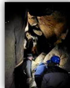
Volunteer-Ranger Höhlen- tour am Quirl im Dezember