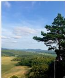
Wanderung auf den Quirl und Pfaffenstein