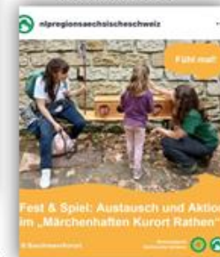
Theaterfest Rathen Frühjahr 2025