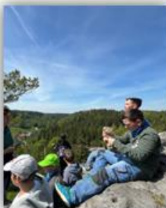
Abschluss Junior-Ranger Ro- senthal am Großvaterstuhl