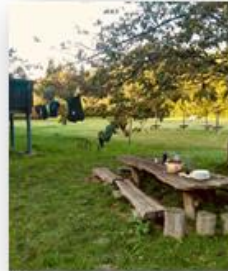
Gem einsam es Abendbrot an der Sellnitz und Sonnenuntergang anschauen