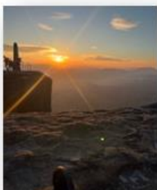
Sonnenaufgang auf dem Lilienstein vor Arbeitsbeginn