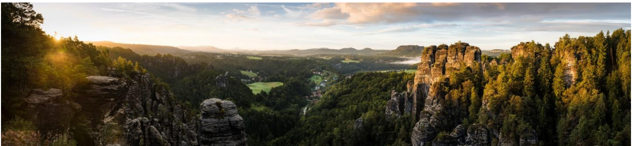
Panorama Sächsische Schweiz

Jetzt aber viel Spaß bei diesem kleinen Exkurs durch mein FÖJ-Jahr 2024/25!