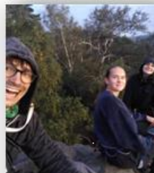
Klettern am Pfaffenstein