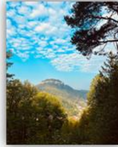
„Schöne Aussicht“ während des Hochwasserprogramms