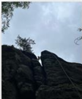
Klettern am Gohrisch