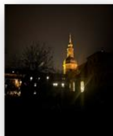
Ausflug der FÖJler in die Thern e im Dezember nach Feierabend