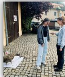
Geweih mit Klarlack präparieren Herbst