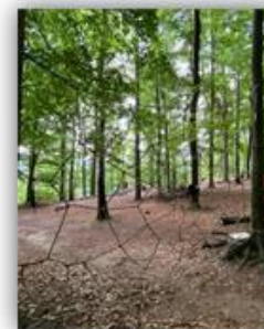
Spinnennetz bei Wald- jugendspielen auf der Sellnitz