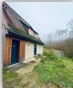
Infostellen winter- fest machen