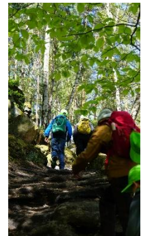
Wanderung zum Bernhardtstein

Wir blicken zurück auf ein ereignisreiches und daher auch anstrengendes, aber vor allem abenteuerreiches und faszinierendes Wochenende. Dabei ließ uns auch das Wetter nicht im Stich und so sollte an diesem Frühlingswochenende bei blauem Himmel und Sonnenschein jede Menge Spaß vorprogrammiert gewesen sein. Weiterhin konnten in diesen zwei Tagen viele neue Eindrücke und spannende Informationen zum Thema Natur erlebt, entdeckt und ausgetauscht werden. Im Fokus des Treffens stand der Austausch zwischen Junior-Rangern aus den beiden Nationalparks der Sächsischen und Böhmisches Schweiz, welcher unter anderem dank der zweisprachigen Moderation und dem Engagement aller Beteiligten ein voller Erfolg war.