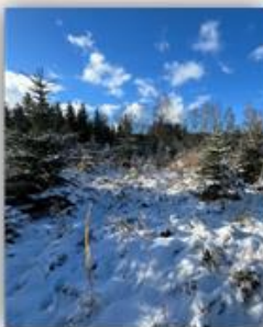
Weihnachtsbäume einsetzen und aufladen