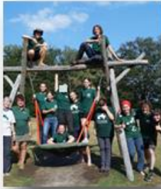
Gruppenfoto Herbst 2024