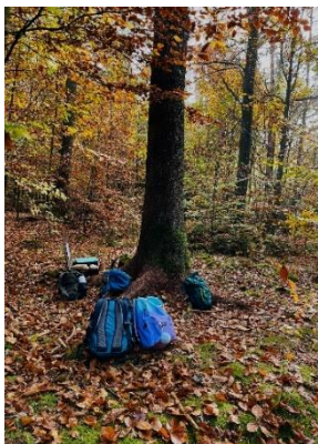
Station zum Thema Pflanzen

Entgegen meiner Erwartungen habe ich großen Gefallen an der Arbeit mit den jüngeren Klassen der Grundschule gefunden, die sich recht leicht für kleine Sachen begeistern lassen.