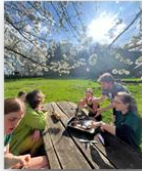
Gemeinsames Mittagessen in den Einführungswochen