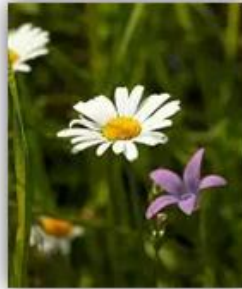
Bergwiesenfest bei Regen