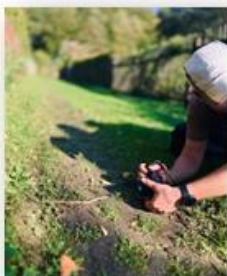
Weg ablaufen/finden für ein Sonderprogramm in Wehlen