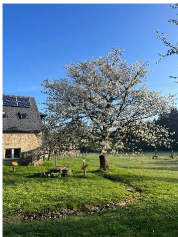
Frühling an der Sellnitz

Genauso wie im Herbst ging es anschließend in die Durchführung der Programme mit den Schulklassen, wobei mir das Programm Wildwiese in Ostrau immer mehr Spaß brachte.